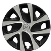
Okrasný kryt AIRFLOW 16"