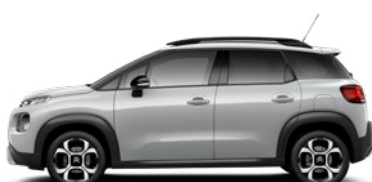
Sivá COSMIC (M)* / Sivá ARTENSE