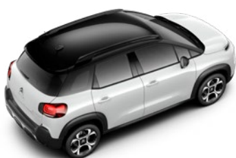
Čierna PERLA NERA