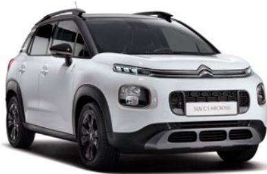
Orámovanie hmlových svetlometov v bronzovej farbe.