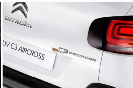
Linie C3 Aircross Origins