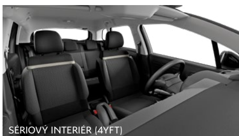
SÉRIOVÝ INTERIÉR (4YFT)