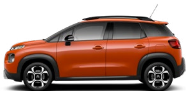
Oranžová SPICY (M)