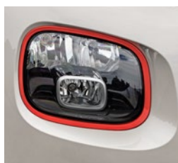
Rámčeky okolo svetlometov