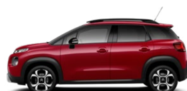
Červená PEPERONCINO (M)