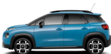
Modrá BREATHING (M)