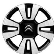
Disk MATRIX 16" Diamantovaný