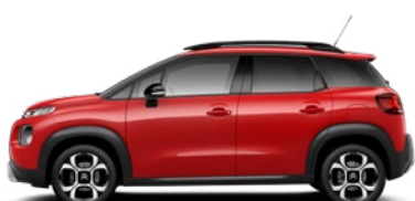
Červená PASSION (Z4P0) *