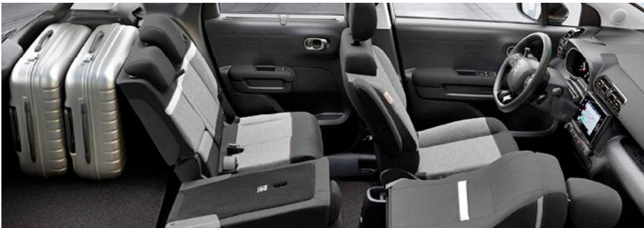
Sedadlá so sivým čalúnením ORIGINS a štepanie v bronzovej farbe