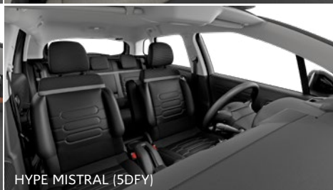
HYPÉ MISTRAL (5DFY)