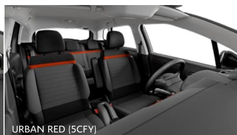
URBAN RED (5CFY)