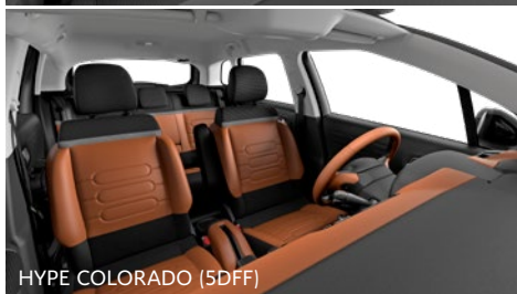
HYPÉ COLORADO (5DFF)