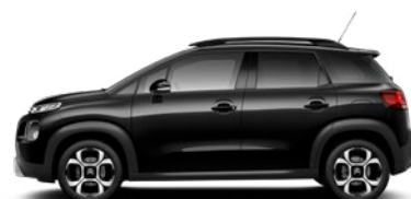
Čierna PERLA NERA