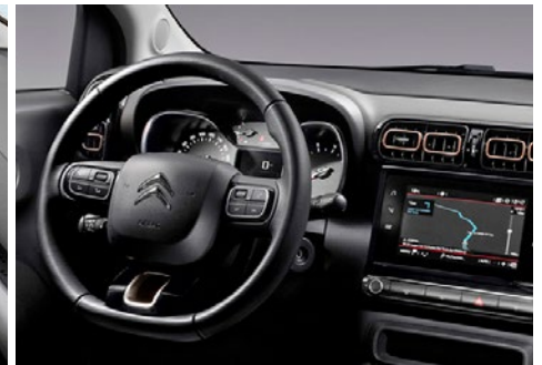
Palubná doska s bronzovým prvkami