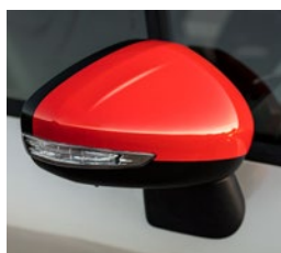
Kryty spätných zrkadiel