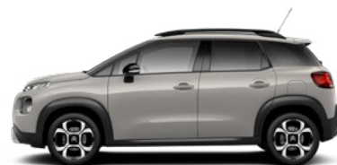
Běžová SABLE (M)