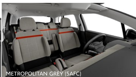
METROPOLITAN GREY (5AFC)