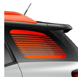
Okienka stĺpika C s pásovým motívom