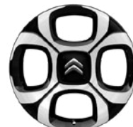
Disk 4 EVER 17" Diamantovaný