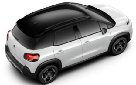
Strecha BITON čierna