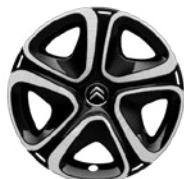
Okrasný kryt 3D 16"