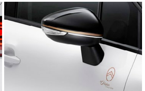
Kryty spätných zrkadiel vo farbe strechy a nálepkami ORIGINS v bronzovej farbe