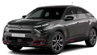
PACK COLOR ANODISED RED