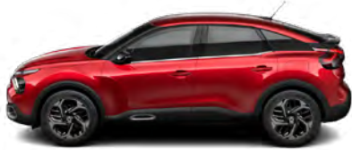
ČERVENÁ ELIXIR (P)

(M) – metalická farba karosérie, (P) – perletová farba