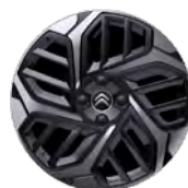
DISK Z LAHKEJ ZLIATINY 18" CAMELIA