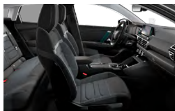
INTERIÉR URBAN GREY (V SÉRII PRE FEEL PACK)