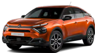
PACK COLOR GLOSSY BLACK