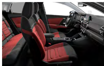
INTERIÉR HYPE RED