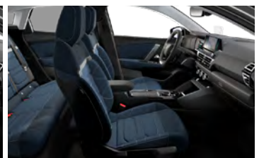
INTERIÉR METROPOLITAN BLUE