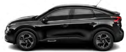
ČIERNÁ OBSIDIEN (M)