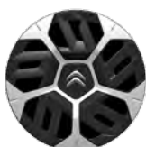
OKRASNÝ KRYT 18" AEROTECH