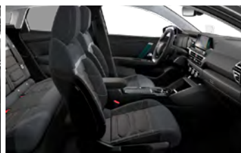
INTERIÉR METROPOLITAN GREY (V SÉRII PRE SHINE)