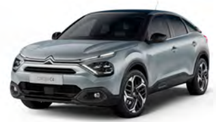
PACK COLOR VAPOR GREY