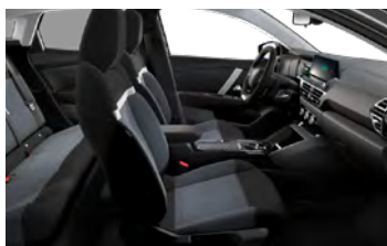
ŠTANDARDNÝ INTERIÉR (PRE LIVE PACK A FEEL)