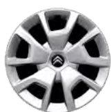
OKRASNÝ KRYT 16" SPRING