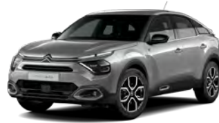
PACK COLOR TEXTURED GREY