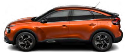
HNEDÁ CARAMEL (M)