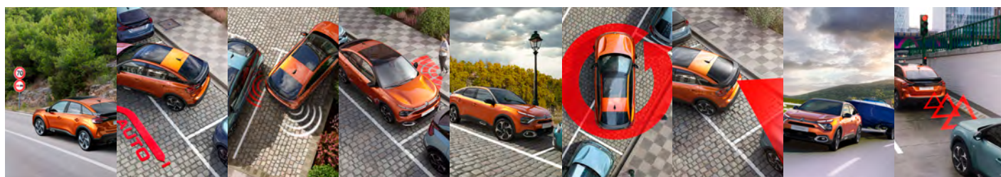
ČÍTANIE DOPRAVNÝCH ZNAČIEK A RÝCHLOSTNÝCH OBMEDZENÍ