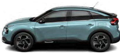
MODRÁ ICELAND (M)