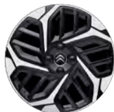
DISK Z LAHKEJ ZLIATINY 18" CAMELIA DIAMANTÉE